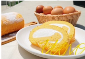
糸島ファームUOVO (天上卵ロールケーキ 他)