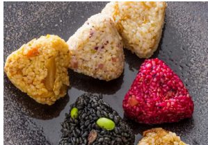
糸島おむすび ふちがみ