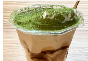
Locavore (ロカヴォール) (八女茶のティラミス 他)

※各ステージイベント・ワークショップ・パネルクイズに参加の方(参加特典商品をご希望の方を含む)はアンケートにご協力をお願いします。