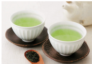
ワンヘルス認証農林水産物 (八女茶 他)