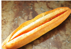
Full Full (明太フランスパン 他)