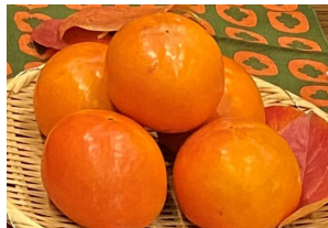
ふくおかエコ農産物 (柿 他)