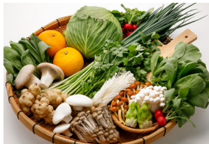
JA全農ふくれん (旬の野菜 他)